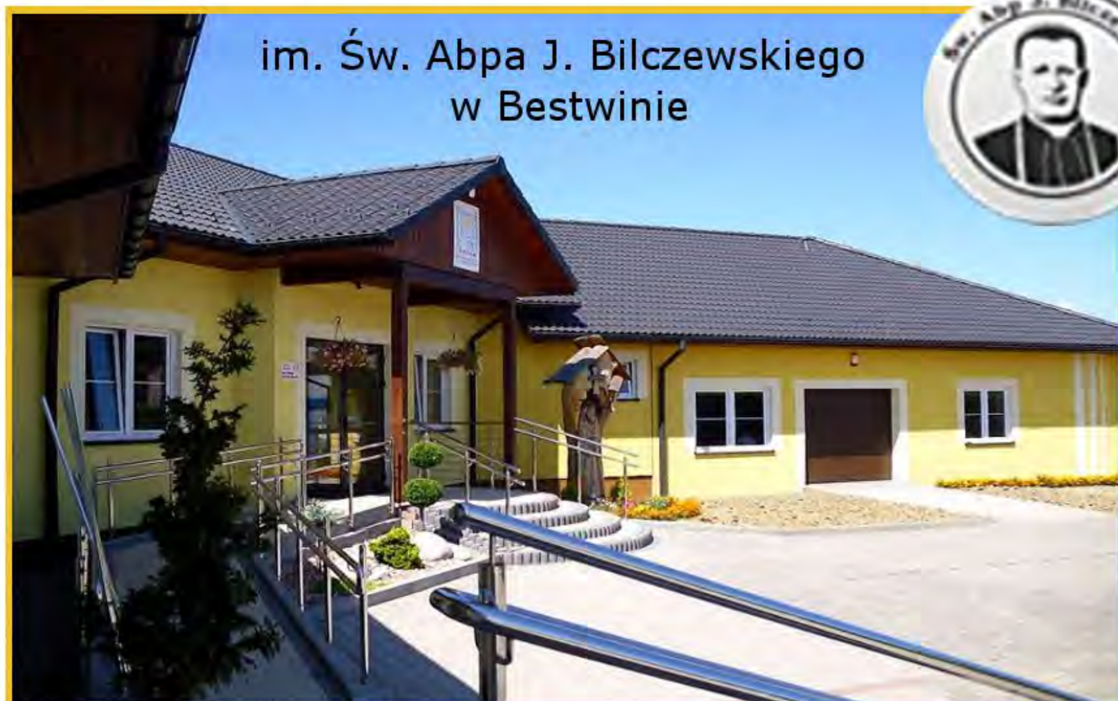
im. Św. Abpa J. Bilczewskiego w Bestwinie